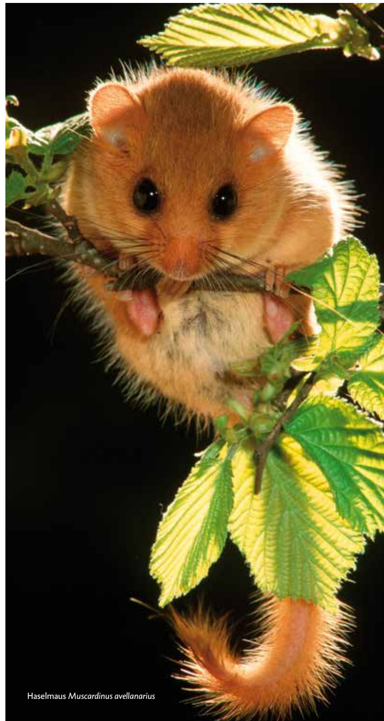
Haselmaus Muscardinus avellanarius

Die Haselmaus erfordert aufgrund ihrer Lebensweise und ihres Schutzstatus' einer gesonderten Betrachtungsweise als terrestrische Säugetierart. Sie ist in Anhang IV FFH-RL gelistet und eine Charakterart artenreicher und lichter Wälder mit gut ausgebildeter Strauchschicht. Haselmäuse bauen im Sommer dichte, kugelige Nester in ca. 0,5 - 1 Meter Höhe bis in die Wipfel der Bäume. Sie überwintern in speziellen Winterschlafnestern zumeist unter der Laubstreu oder in Erdhöhlen, aber auch zwischen Baumwurzeln oder in Reisighaufen, selten auch in Baumhöhlen oder Nistkästen. Haselmäuse sind nachtaktiv und bewegen sich meist weniger als 70 Meter um das Nest und sind dabei fast ausschließlich in der Strauch- und Baumschicht unterwegs. Gehölzfreie Bereiche wie z. B. breit ausgebaute Zuwegungen können daher für die Boden meidende Art bereits eine Barriere darstellen. Für den Bau von WEA in Haselmaushabitaten sind deshalb die Tötungs- und Schädigungsverbote des § 44 BNatSchG zu beachten. Fortpflanzungs- und Ruhestätten können auf mehrere Arten geschädigt werden: Ein Fällen von Gehölzen, die von der Haselmaus bewohnt werden, würde im Sommer die Nester zerstören. Bei Fällarbeiten im Winter können, insbesondere bei Einsatz von schwerem Gerät, Winterquartiere zerstört und die Bewohner tödlich verletzt werden (Tötungsverbot). Für