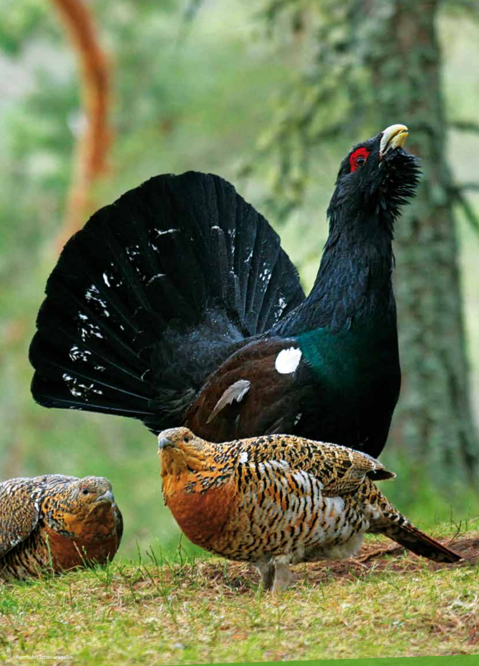
Auerhuhn Tetrao urogallus