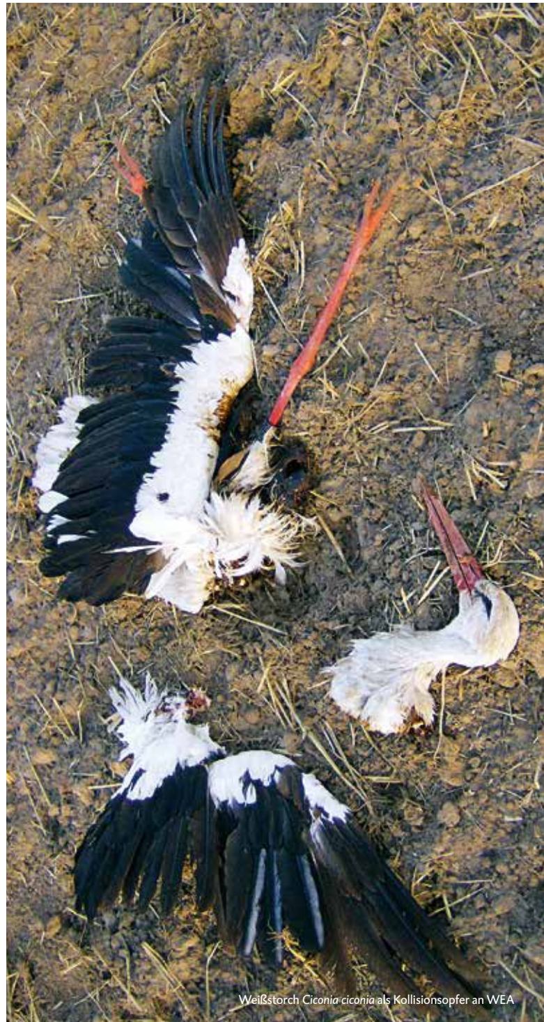
Weißstorch Ciconia ciconia als Kollisionsopfer an WEA