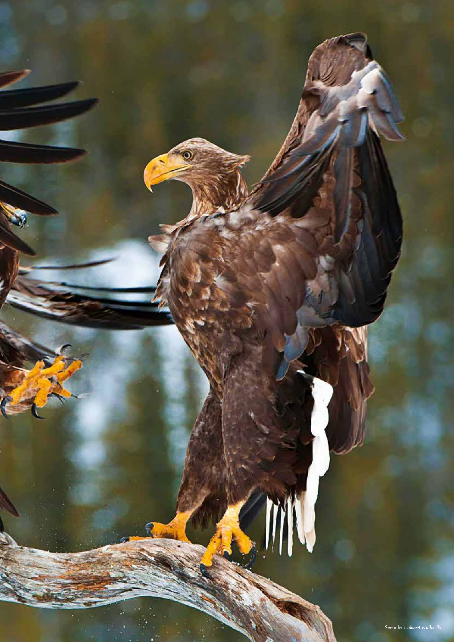
Seadler Haliaeetus albicilla