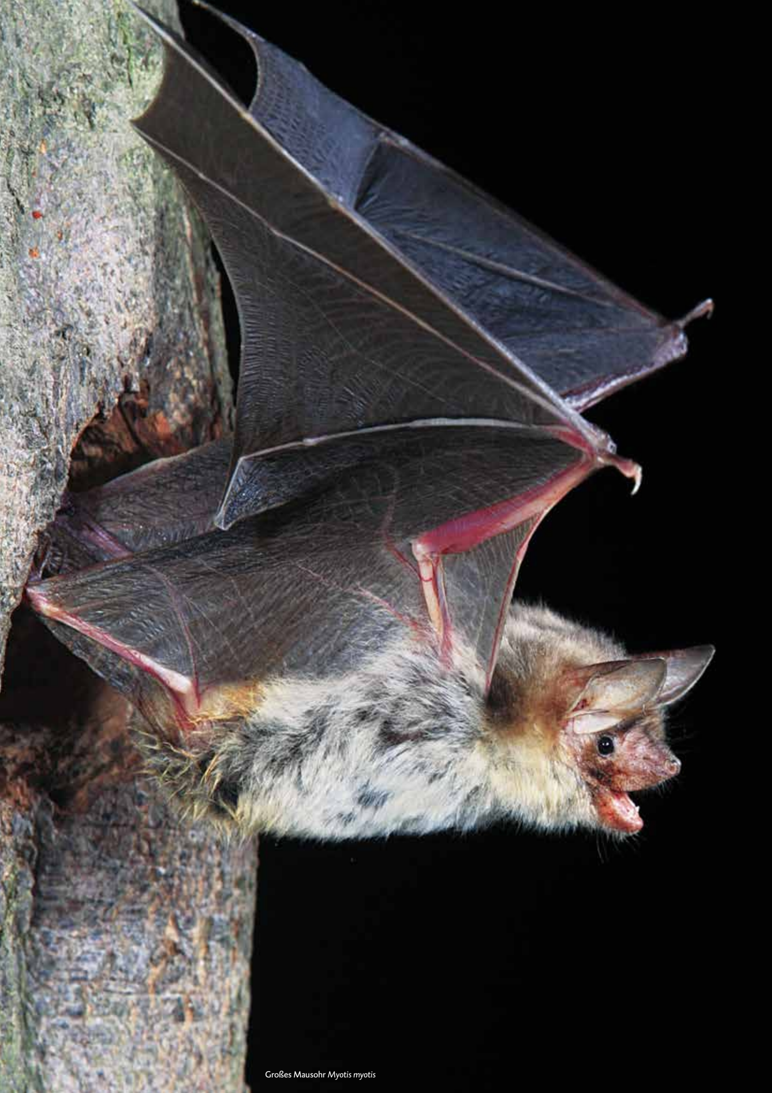
Großes Mausohr Myotis myotis