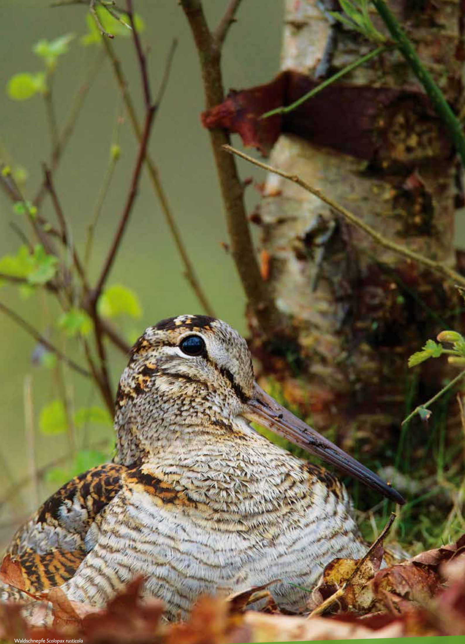
Waldschnepfe Scolopax rusticola