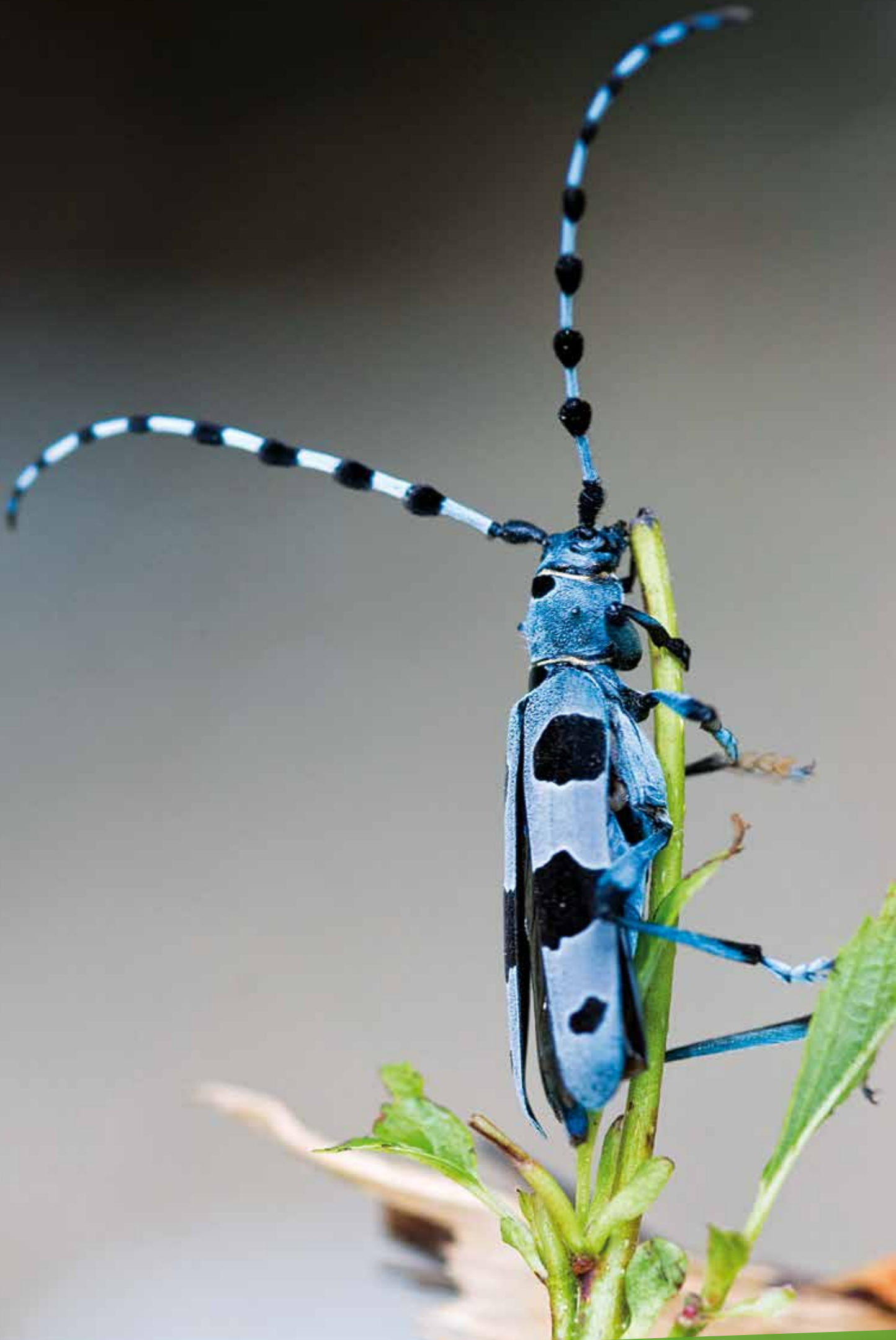
Alpenbock Rosalia alpina